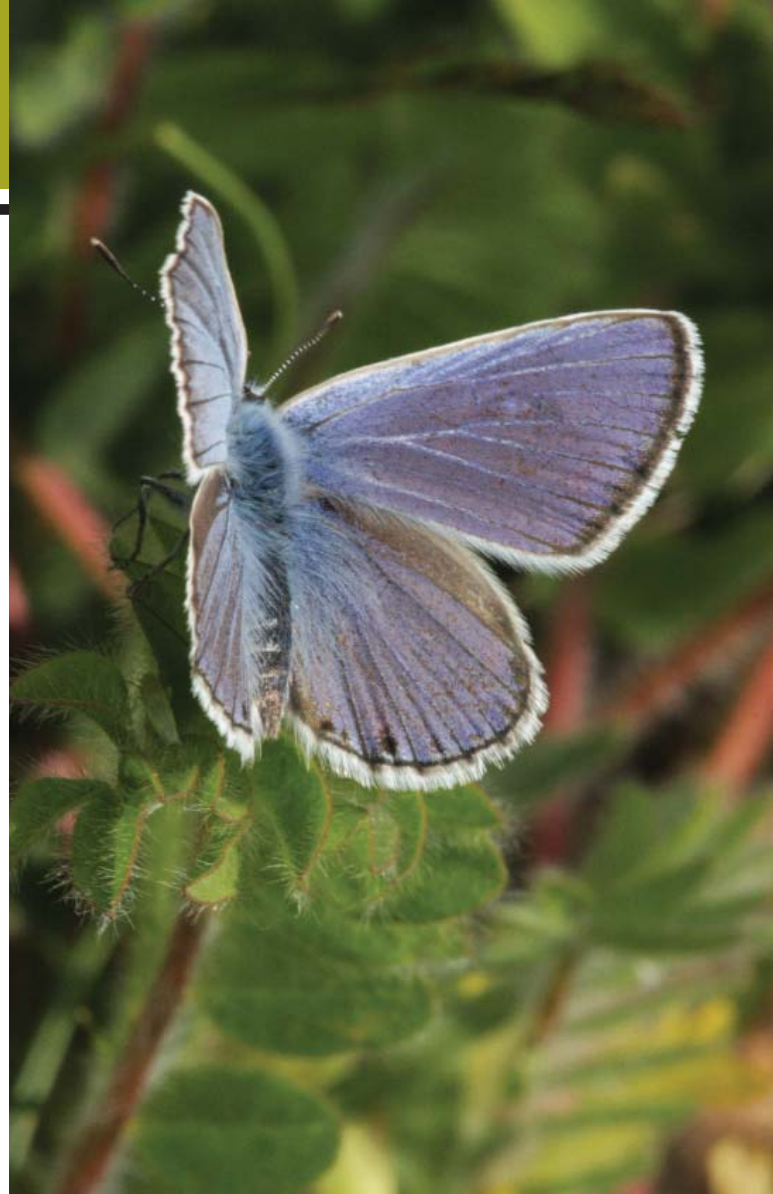
Fóti boglárka szártalan csüdfüvön