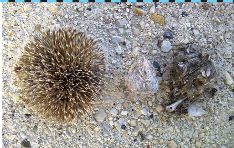
A kifordított sünbőr az uhuk jelenlétére utaló legbiztosabb jel