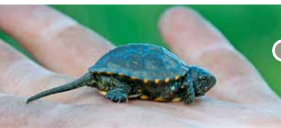
Mocsári teknős ( Emys orbicularis )

A mintegy 30 hektáros területre kiváló betekintést ad a temető melletti feltöltésen lévő kilátópont, ahol információs tábla is található.