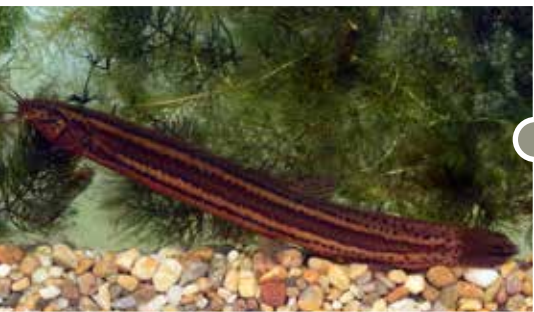
Réticsík ( Misgurnus fossilis )

Az egykori holtágak lefűződött kanyarulatai, a morotvák több helyen is megőrződtek. Ezek egyike a jellegzetes alakú, alig egyhektáros Kifli-tó. Partján nyílfű és virágkaka tenyészik. A víz fölé hajló ágokról jégmadár lesi zsákmányát. Tájéképileg is kellemes, szemet gyönyörködtető terület.