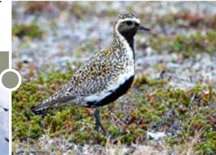
Aranylile ( Pluvialis apricaria )

Az Ipoly alföldi jellege leginkább itt ragadhatja magával a szemlélődőt: erről a 200 hektáros legelőről körülnézve egyaránt jól láthatók a Korponai-dombság és a Börzsöny lankái. A tavaszi elöntések idején számos madárfaj – köztük az aranylile és a tundralúd – ezres csapatai találnak itt elsőrangú táplálkozó- és pihenőhelyet. A korán kelő madarászokat egy megfigyelőtorony segíti a számlálási munkában.