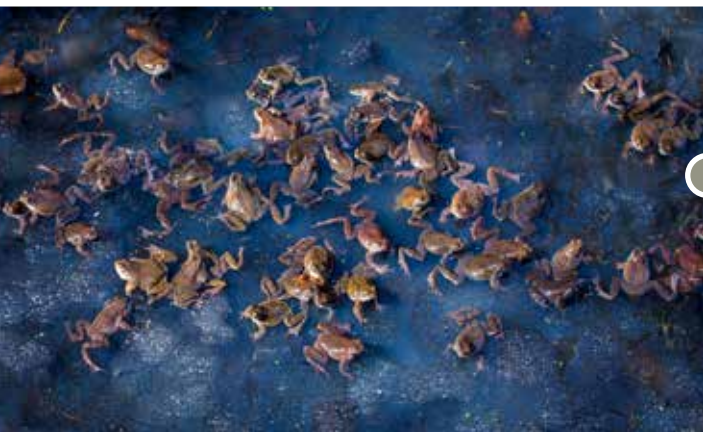
Gyepi békák násza.

A nádasok helyenként elérik a háromméteres magasságot is. A bokorfüzesek és égeresek áthatolhatatlan dzsungelében biztonságban szaporodik az élet ezernyi formája.