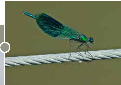
Sávós szitakötő ( Calopteryx splendens )

Ez az 50 hektáros terület új erőre kapott a már egy évtizeddel korábban megindított vízkormányzások révén. A nyílt vizes és benövényesedett rézszek váltakozása, az élőhelyi változatosság lehetőséget nyújt számos kételtű (pl. zöld levelibéka, barna ásóbéka, vöröshasú unka) és itt fészkelő madár (pl. szárcsa, vörös gém, barna rétihéja) megfigyelésére, amelyre az Ipoly-híd túraútvonal mentén elhelyezett „magasleselkedőből” van a legnagyobb esély.