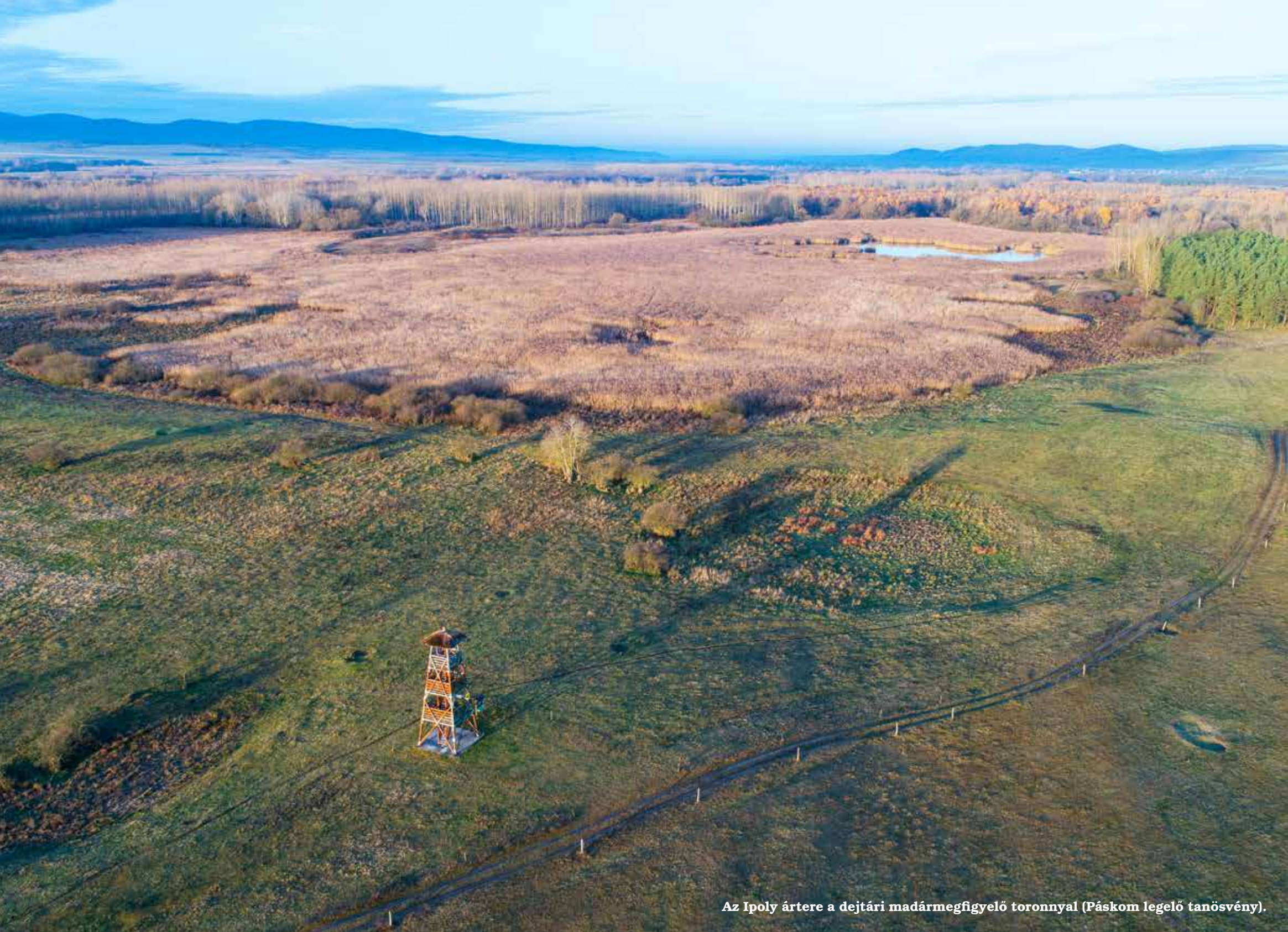
Az Ipoly ártere a dejtári madármegfigyelő toronnyal (Páskom legelő tanösvény).