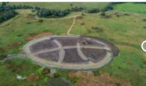
Az élőhely-rekonstrukció munkálatai 2019 őszén és 2020 tavaszán.

A beruházás közvetlenül több mint 200 hektárt érintett, ám ennek nehezen felmérhető többszöröse az, ahol a környék, illetve a talaj vízellátása javult.