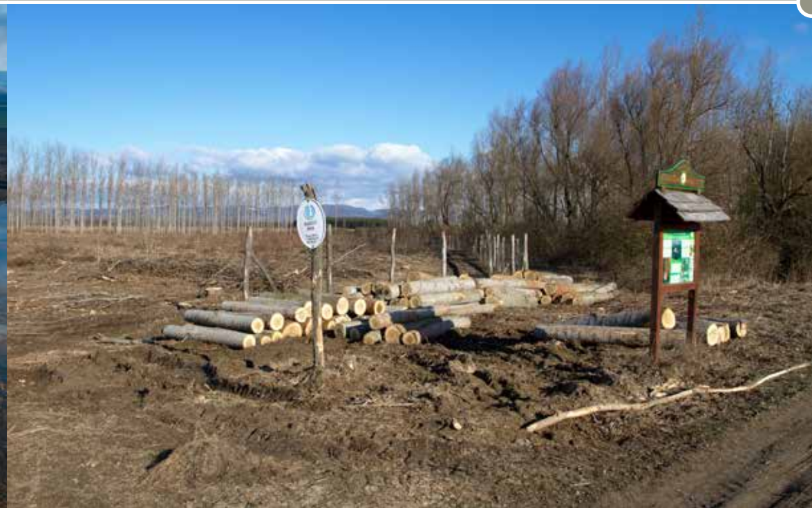
Az ültetett facsemetékert kerítés védi az őzek, szarvasok rágásától.

A védett erdőterületek esetében elindítottuk az itt nem honos, egykor mesterségesen idetelepített fafajok (leginkább a nemesnyár) cseréjét a hazai lombos erdőkre jellemző fákra (rezgő- és szürkenyár, mézgás éger, kőrisek). E lassú folyamat eredményeképp a táj gazdagodása, sokféleségének növekedése várható.