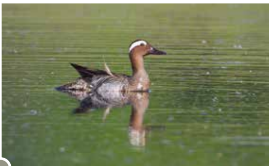
Bőjtői réce ( Anas querquedula )

A település végén elterülő, a folyó összeszűkülő részén – így szinte már a Börzsöny lábánál – fekvő mintegy 40 hektáros rét leginkább a kora tavaszi időszakban látványos, amikor a récék, parti madarak, nagy kócsagok és fekete gólyák gyülekezőhelyévé válik. A későbbiekben pedig a harisok fészkelésére alkalmas dús fűvű legelőket találhatunk itt.